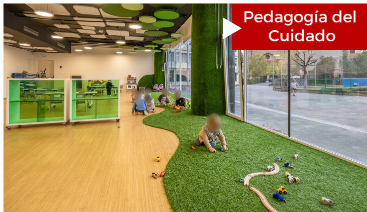
Pedagogía del Cuidado